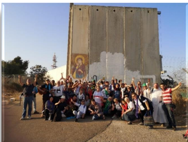
Icône de « Notre Dame qui fait tomber les murs » écrite sur le « mur » à Bethléem, devant le monastère de la Communauté des sœurs de l'Emmanuel.