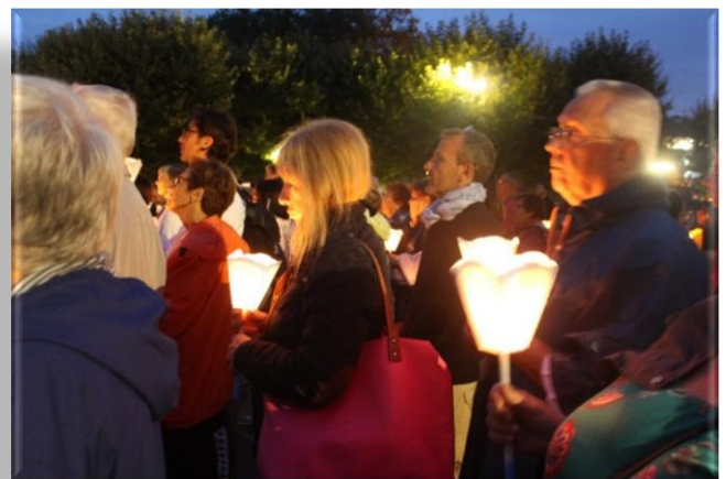
Pèlerinage Saint Laurent – août 2018