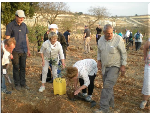
Rencontre de l'Association « Tent of Nation » en Cisjordanie. Aide à la replantation.